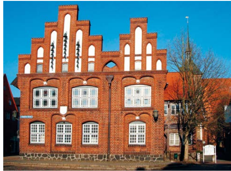
Außenansicht vom Alten Rathaus