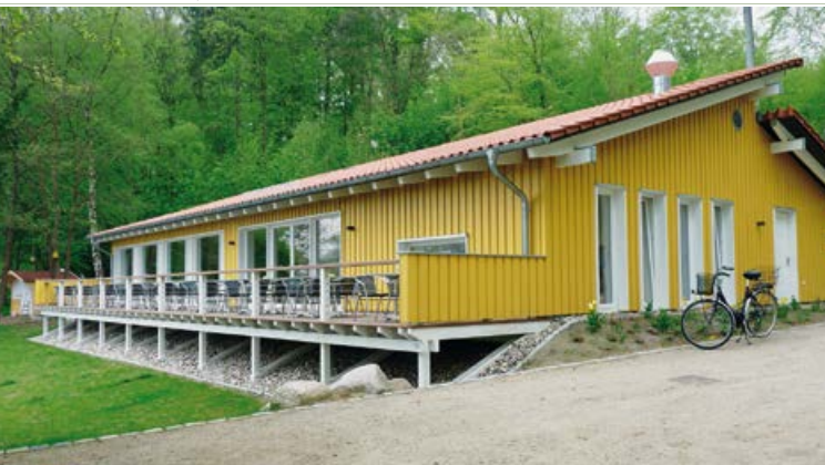
Fährhaus „Hollersche Anlagen“

Das Alte Rathaus ist Treffpunkt für die regelmäßig stattfindenden Stadtführungen.