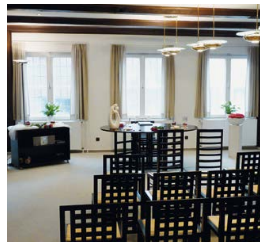
Modernes Trauzimmer im Erdgeschoss des Alten Rathauses