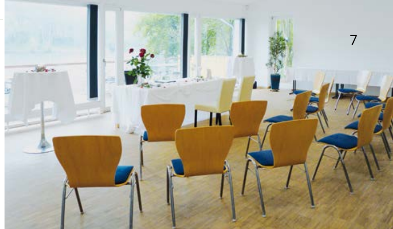
Trauzimmer im Fährhaus „Hollersche Anlagen“