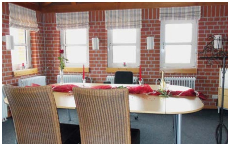
Turmzimmer im Jugendfeuerwehrzentrum

Viele Brautpaare wünschen sich eine schöne und feierliche Atmosphäre. Dabei spielt nicht nur die Raumfrage eine Rolle, sondern nach Wunsch auch eine kleine musikalische Untermalung der Zeremonie. Wir haben in unseren Trauzimmern die Möglichkeit, Musik von CD nach Ihren Wünschen abzuspielen. Vielleicht gibt es in Ihrer Familie oder in Ihrem Freundes- und Bekanntenkreis Musiker, die Ihnen eine Freude mit einem persönlich vorgetragenen Stück machen möchten?