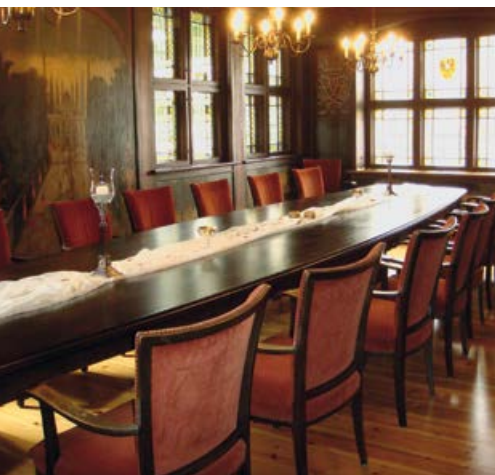
Senatszimmer im Alten Rathaus

Sie möchten die Räumlichkeiten des Alten Rathauses bereits vor Ihrer Trauung besichtigen oder sind neugierig auf das Alte Rathaus und seine Geschichte geworden?