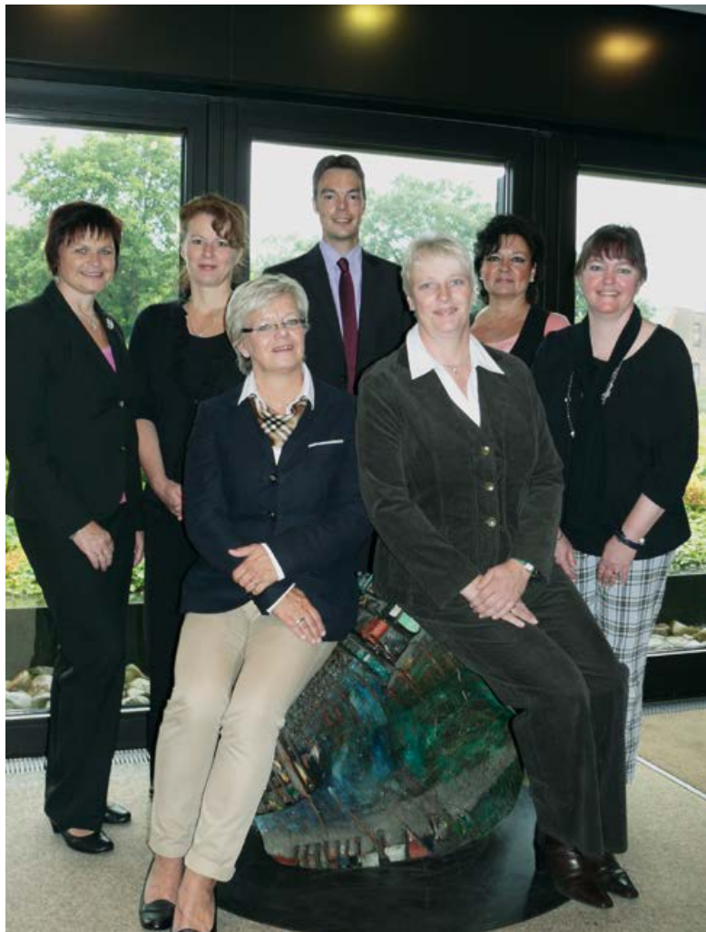
Das Team der Verwaltungsgemeinschaft

In dieser Broschüre stellen wir Ihnen unsere Räumlichkeiten vor und haben darüber hinaus einiges Wissenswerte rund um die Hochzeit für Sie zusammengestellt.