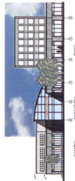
ANSICHT FRIEDRICHSTÄDTER STRASSE

ARCHITECTUR DPL.-ING. HELMUT HANSEN ARCHITECT + PLANNING DPL.-ING. BÄRBEN HANSEN ARCHITECT + PLANNING AM OTTENHAIN 2 24768 RENDSBURG TEL. 0431/1324-0 FAX 0431/1324-24