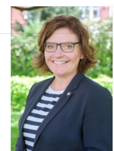
Iris Ploog, Bürgermeisterin der Stadt Rendsburg